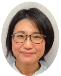
臨床心理士・公認心理師